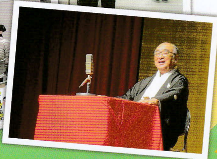
※写真は令和元年度のイベントの様子です。